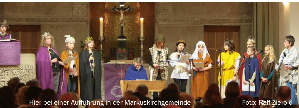
Hier bei einer Aufführung in der Markuskirchgemeinde

Mancher wird fragen, wann in Paulus mal wieder ein Musical oder Singspiel aufgeführt wird. Es wird mit abhängig davon sein, wie viele Mitglieder unser Kinderchor hat und wie viele andere Kinder sich darauf einlassen können, diese zu unterstützen. Derzeit singen in